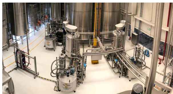
Sucroliq suikerraffinagefabriek in Irapuato (MX)

Sucroliq heeft een ruime ervaring in het voldoen aan de verschillende wensen van de klanten. Met 3 fabrieken in Mexico, met een jaarlijkse productiecapaciteit van 350.000 MT vloeibaar suiker, bevinden zij zich midden in het proces van internationale groei.