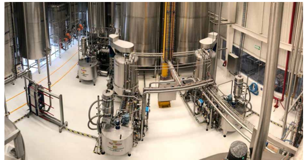
Sucroliq suikerraffinagefabriek in Irapuato (MX)

Sucroliq heeft een ruime ervaring in het voldoen aan de verschillende wensen van de klanten. Met 3 fabrieken in Mexico, met een jaarlijkse productiecapaciteit van 350.000 MT vloeibaar suiker, bevinden zij zich midden in het proces van internationale groei.