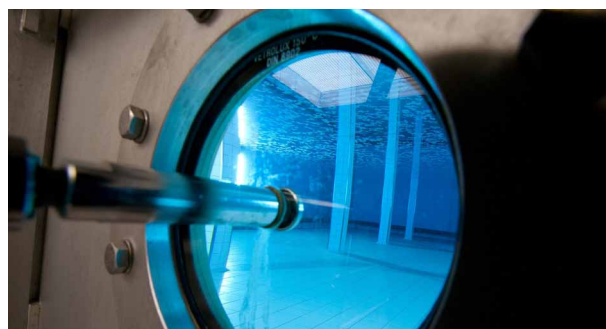
Réserve d'eau du Wasserwerk Reinach und Umgebung

Le „Wasserwerk Reinach und Umgebung“ (compagnie de distribution des eaux pour Reinach et ses environs) exploite avec succès le Netilion Smart System pour la surveillance du niveau de la rivière et des paramètres clés de la qualité de l'eau. Les valeurs de mesure peuvent être surveillées au moyen d'un smartphone et d'un système de contrôle commande.