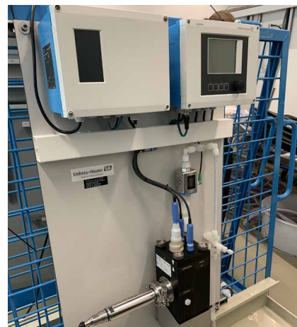
Platine d'analyse pour le traitement des valeurs de mesure